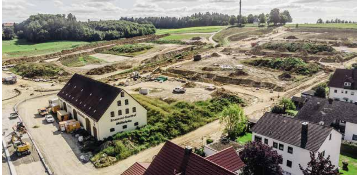
Im künftigen Wohngebiet Pfaffelleiten geht die Erschließung gut voran.

Damit angesichts des Drucks von außen auf den Pfaffenhofener Immobilienmarkt auch Einheimische sich das Wohnen und Bauen hier leisten können, wurde schon vor vielen Jahren