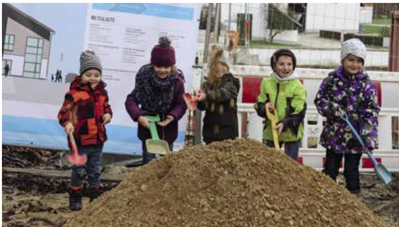
Kinder der Kita St. Elisabeth beim „Spatenstich“ in Affalterbach