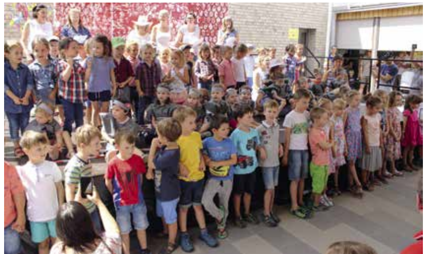
Der Neubau der Kita St. Andreas wurde beim Sommerfest eingeweiht.