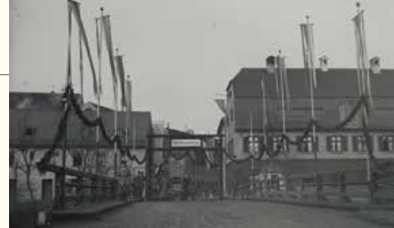
Girlanden an der Münchener Straße waren ein herzlicher Willkommensgruß für die von der Front zurückkommenden Soldaten (Dezember 1918).

Doppeldecker warfen Flugblätter über der Stadt ab, um die Bevölke-