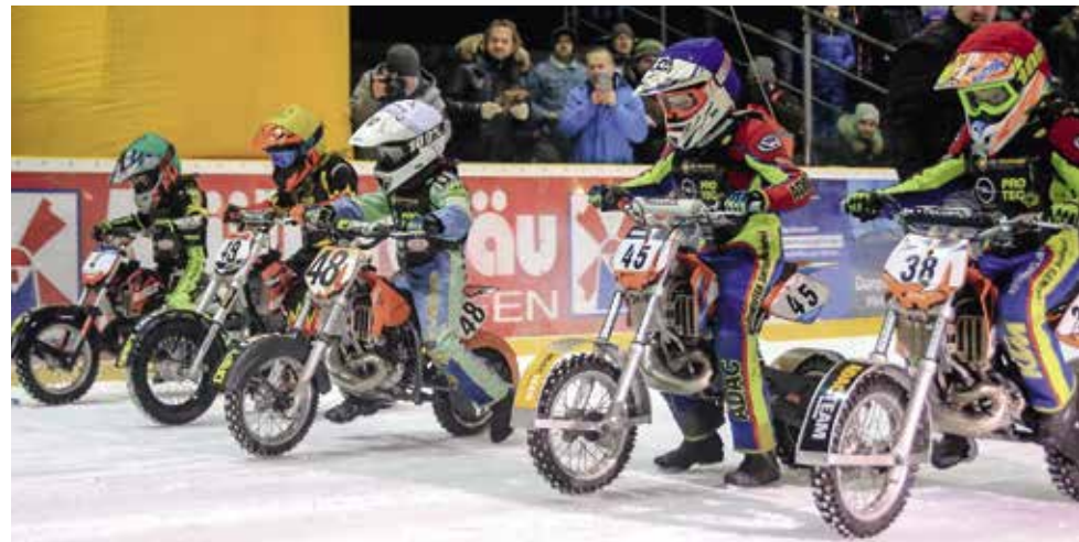
Bei der Pfaffenhofener Premiere waren sie Publikumsbeliebte: die Junioren!

Jetzt folgt die Neuauflage: Dass das Spektakel wiederholt werden sollte, darüber war man sich beim ausrichtenden MC Eisdrifters Meißen sowie beim MSC Pfaffenhofen schnell einig, zumal viele Nachfragen von Fans kamen. Pfaffenhofen wird dabei zur zweiten Station einer Rennserie. Erneut wird also ein Lauf der beliebten Rennserie