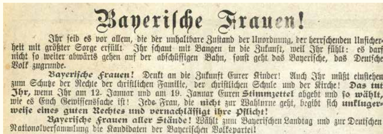
Aufruf der BVP an die Frauen, von ihrem Wahlrecht Gebrauch zu machen und die politischen Geschicke künftig mitzubestimmen (Januar 1919)

Andreas Sauer, Stadtarchivar www.pafunddu.de/22676