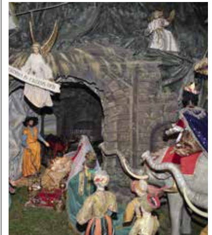
Immer wieder schön: die traditionsreiche Krippe in der Spitalkirche

Für viele Pfaffenhofener ist der Besuch der jahrhundertealten Krippe in der Spitalkirche eine alljährlich wiederkehrende Tradition. Seit Generationen besuchen viele Familien die Krippe regelmäßig – und zwar mehrmals, denn die Darstellungen werden immer wieder ergänzt und verändert. Vor allem für Kinder ist die Krippe mit ihren zwölf aufeinander folgenden Darstellungen ein großer Anziehungspunkt.