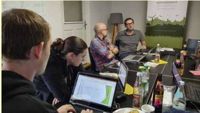
Rauchende Köpfe und viele Ideen bei den Teams des ersten Pfaffenhofener Thinkathon

Rund 40 TeilnehmerInnen und ExpertInnen beschäftigten sich beim Workshop-Format FuturePAF Thinka-