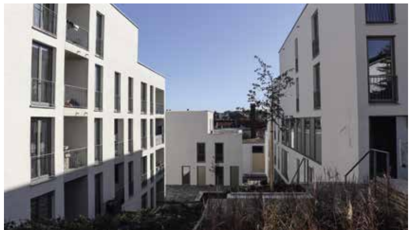
32 öffentlich geförderte Wohnungen der WBG wurden an der Kellerstraße bezogen.