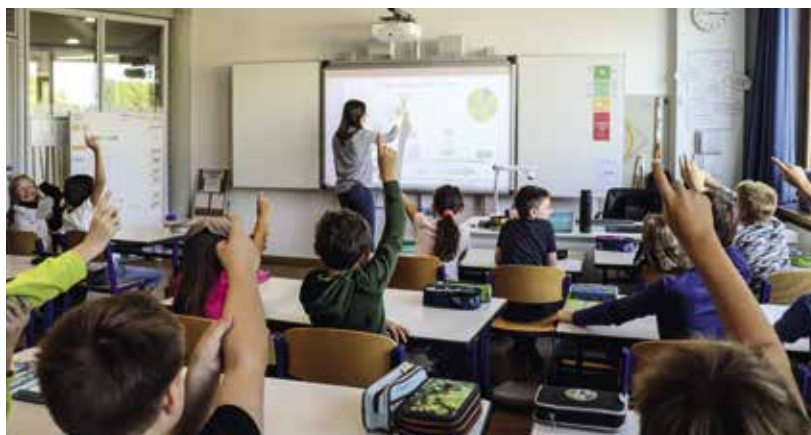
Die Digitalisierung an den städtischen Schulen ist auf den Weg gebracht. Vorreiter ist hier die neue Grund- und Mittelschule Pfaffenhofen.

Im Sport- und Freizeitbereich macht nicht nur der Bau des Hallenbads von sich reden. Im vergangenen Frühjahr wurden auch der neue Trimm-Dich-Pfad und ein zusätzlicher Spielpfad im