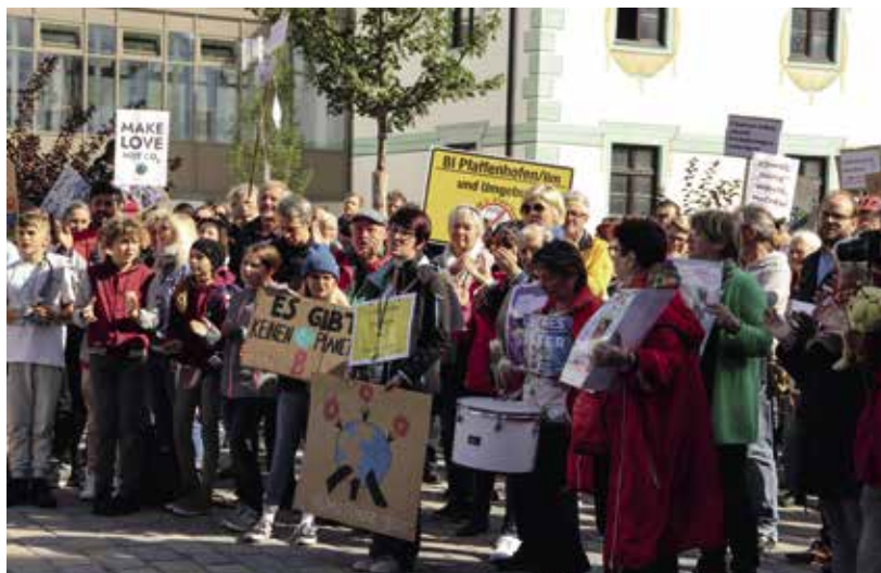
Klimademo auf dem Hauptplatz: Seit dem Herbst gibt es in Pfaffenhofen auch eine Ortsgruppe von Fridays for Future.

2013 hat Pfaffenhofen den Deutschen Nachhaltigkeitspreis erhalten. Für den Preis 2020 war die Stadt jetzt wieder unter den Nominierten – und zwar gleich zweimal, denn auch für den Sonderpreis Digitalisierung war sie in der engen Wahl. Ein Argument dafür war nicht zuletzt auch die Digitalisierung der Schulen, die an der neuen Grund- und Mittelschule auf den Weg gebracht wurde und nun auch an den beiden anderen städtischen Schulen folgen soll.