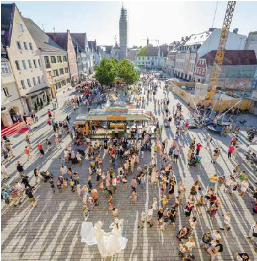
Der Kultursommer 2019 hatte wieder viel zu bieten. Die Besucher waren begeistert!