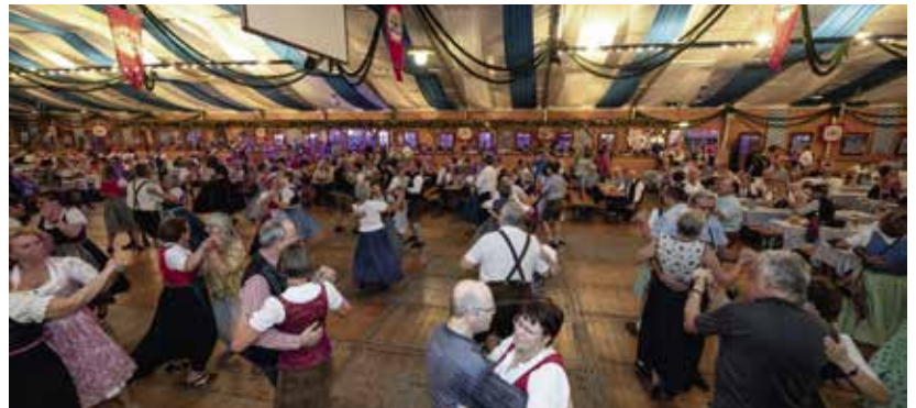
Neues Zugpferd beim Volksfest: Der Volkstanzabend im großen Zelt kam sehr gut an.