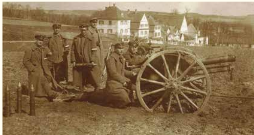
Richtung Bahngleis gerichtete Geschütze werden von bewaffneten, an ihren Armbinden erkennbaren „weißen“ Freikorps-Angehörigen bewacht (April 1918).

In der bayerischen Landeshauptstadt eskalierten nach der Ermordung Kurt Eisners am 21. Februar 1919 die Auseinandersetzungen zwischen den