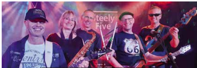
Die Band Steely Five gastiert am 1. Februar im Musikklub 14/1.

Im Januar und Februar gibt es jede Menge auf die Ohren, denn der Musikklub 14/1 lädt bei sieben Konzerten zum Abfeiern ein.