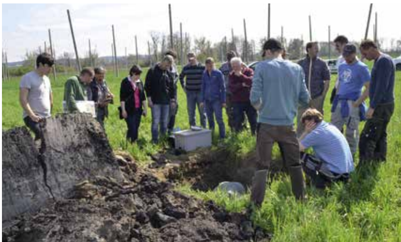
Die Bodenallianz hat sich zu einem Vorzeigeprojekt entwickelt.