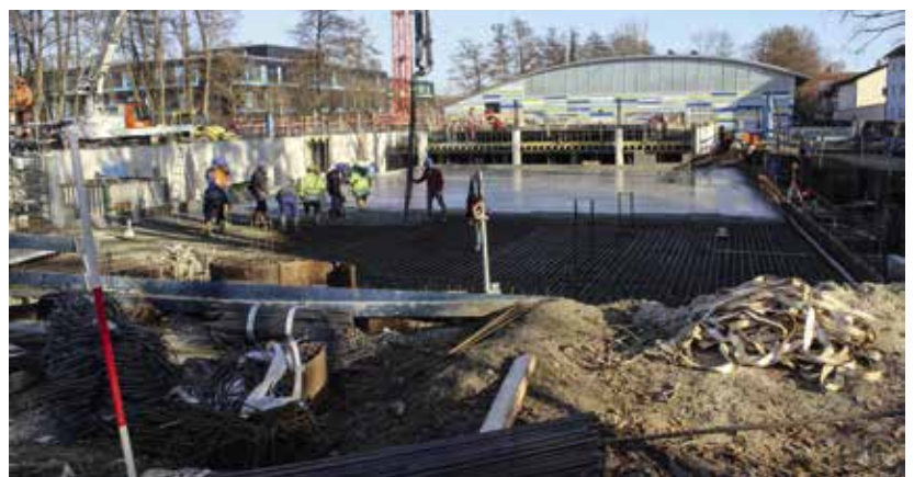
Großbaustelle Hallenbad: Seit dem Spatenstich im Mai geht der Neubau zügig voran.