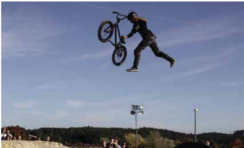
Der neue Dirt Park am Kuglhof ist ein El Dorado für Bikerinnen und Biker.