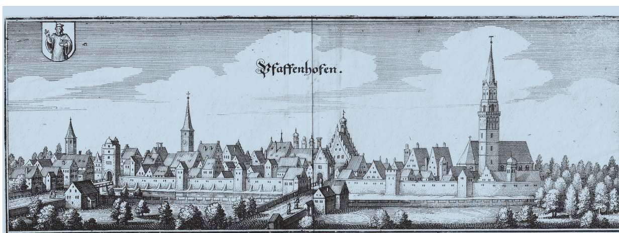
Diese Stadtansicht zeigt Pfaffenhofen im letzten Drittel des 17. Jahrhunderts

Im Jahr 1438 wurde Pfaffenhofen zum ersten Mal urkundlich als Stadt bezeichnet. Das ist jetzt 575 Jahr her – ein schöner Anlass, um das Ereignis mit einem Bürgerfest am Samstag, 15. Juni, von 17 bis 24 Uhr auf dem Hauptplatz zu feiern.