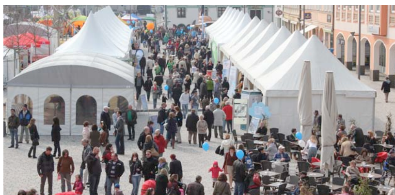
Der Klimaschutztag war auch ein großes Bürgerfest auf dem Hauptplatz