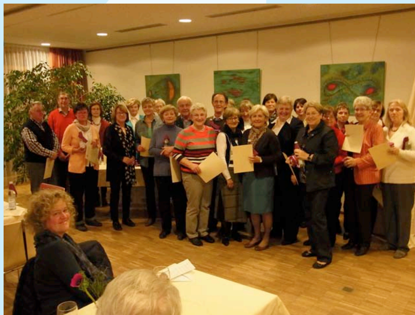
Die langjährigen ehrenamtlichen MitarbeiterInnen der Pfaffenhofener Tafel.

schön an alle Ehrenamtlichen für ihren Einsatz, der oft schwere körperliche Arbeit bedeutet. Ihren Vorstandskollegen dankte sie für den immensen Zeitaufwand und die gute Zusammenarbeit. Und ganz besonders dankte sie den Sponsoren für ihre Geld- und Sachspenden und dem Träger der Tafel – der Evangelisch-lutherischen Gemeinde Pfaffenhofen – sowie der Stadt und dem Landkreis Pfaffenhofen und mehreren Firmen für ihre Unterstützung. 59 Lieferanten bzw. Hersteller versorgen die Tafel regelmäßig mit Lebensmitteln.