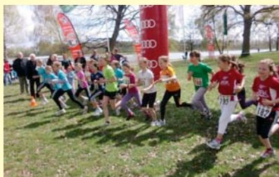
Mit Laufspielen und gymnastischen Übungen werden die Kinder gefördert

„Laufen ist kinderleicht“ – unter diesem Motto bietet die Leichtathletikabteilung des MTV seit Anfang Mai ein Lauftraining für Kinder im Alter von 7 bis 10 Jahren an. Mit Laufspielen und gymnastischen Übungen werden die Kinder gefördert. Unter Anleitung finden die Übungsstunden ausschließlich im Freien regelmäßig donnerstags 15:30–16:30 Uhr in der Kreissportanlage an der Scheyerer Straße (Zugang über Adolf-Rebl-Straße) statt. Eine Anmeldung ist nicht erforderlich. Bitte Sportschuhe und geeignete Trainingskleidung mitbringen, weitere Auskunft telefonisch 08441-82963 oder per E-mail unter kinderlauf.paf@gmx.de . pafunddu.de/1366