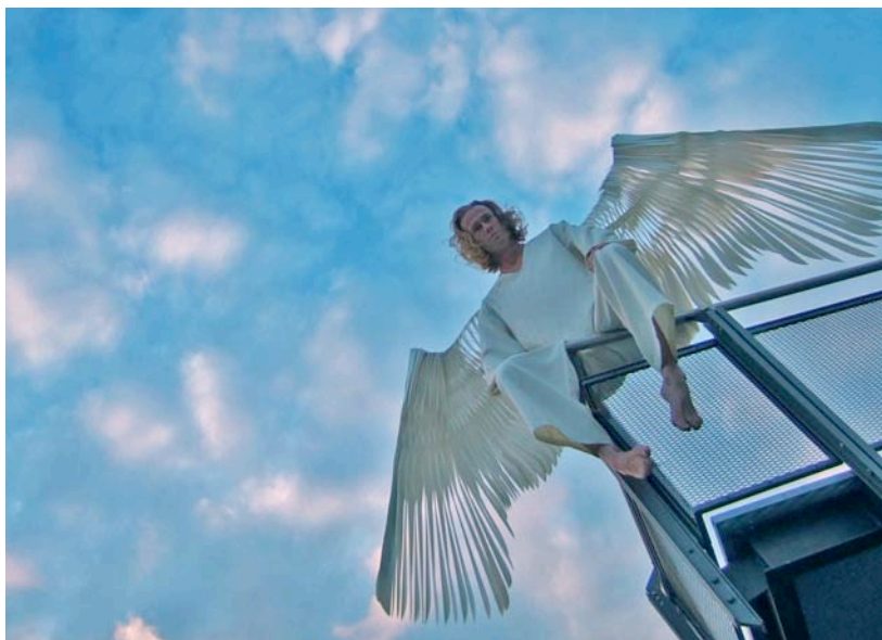
Ein Engel begegnet den Pfaffenhofenern bei der Eröffnung der Paradiesspiele