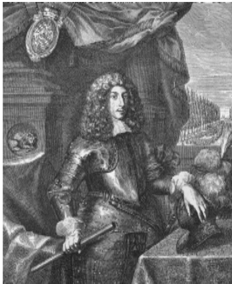
Ferdinand Maria, Kurfürst von Bayern 1651-1679

Zunächst war in den Jahren vor 1671 landesweit eine Visitation erfolgt, bei der in ganz Altbayern die Verhältnisse vor Ort überprüft worden waren und die Notwendigkeit einer neuen Steuererfassung deutlich zu Tage trat. Daher wurde vom bayerischen