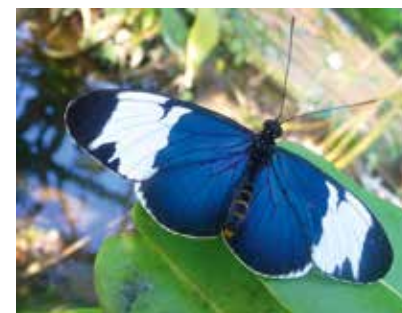
Ein Bewohner des Schmetterlingshauses: der Passionsblumenfalter

Das Schmetterlingshaus garantiert bei hoher Luftfeuchtigkeit ein tropisches Erlebnis für alle Sinne: Farbenpracht für die Augen, ungewöhnliche Düfte, zarte Flügelschläge... Hochinteressant ist aber auch der komplexe Lebenszyklus einiger Schmetterlingsarten: Hautnah beobachten kann man die Entwicklung vom Ei über die gefräßige Raupe, die sich nach mehreren