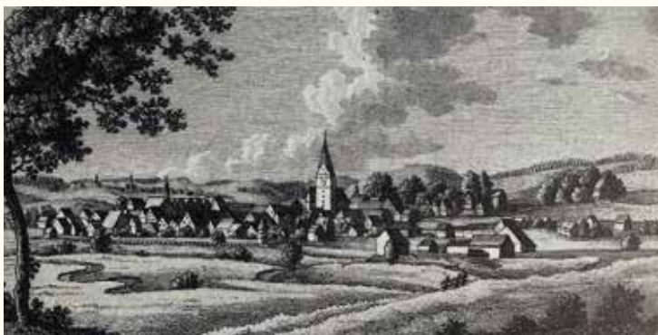
Ansicht der Stadt aus dem Jahr 1815

gibt es kostenlos im Bürgerbüro, in der Stadtverwaltung, im Haus der Begegnung sowie unter pafenhofen.de/stadtgeschichten www.pafunddu.de/32371