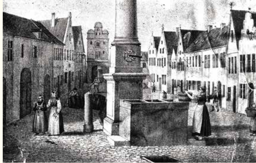
Alltagsszene aus der „Dirlgasse“, der heutigen Frauenstraße (Augustin Schwarz, 1833)

Zwei Beamte am Landgericht Pfaffenhofen erwiesen sich im beginnenden