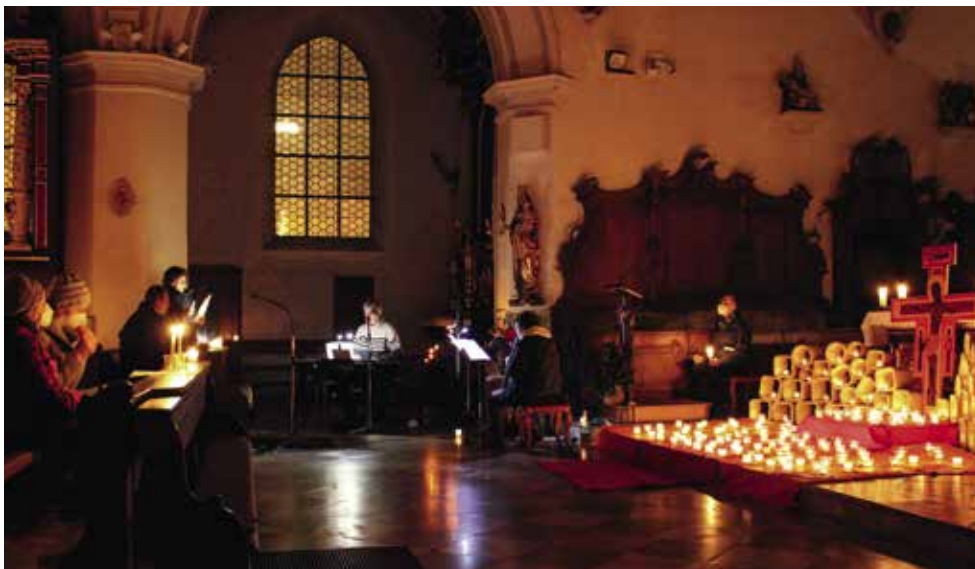
Eine ganz besondere Atmosphäre herrscht immer bei der „Nacht der Lichter“ (Bild von 2021).

Den Dunkelheiten unserer Zeit ein bisschen Helligkeit entgegensetzen – das beabsichtigen die Organisatoren der „Nacht der Lichter“. Zu diesem Gebets- und Liederabend laden die Taizé-Gruppen der katholischen Stadtpfarrei, der evangelisch-lutherischen Gemeinde und der katholischen Pfarrgemeinde Niederscheyern ein. In der nur mit Kerzen beleuchteten Stadtpfarrkirche werden mit instrumentaler Begleitung besinnliche Lieder aus Taizé gesungen, ergänzt von Gebeten und Texten sowie Meditation und Stille.