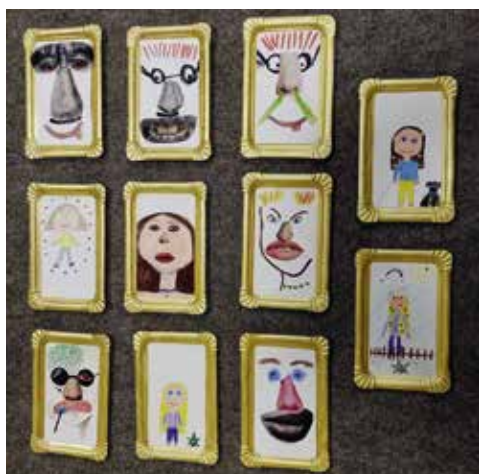
Diese Kunstwerke haben die teilnehmenden Kinder am „Museumstag“ geschaffen.