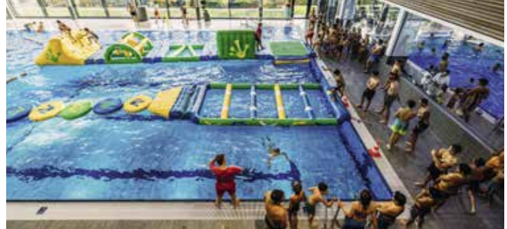
Trocken blieb niemand bei Pfaffenhofens größter Poolparty im Gerolsbad.