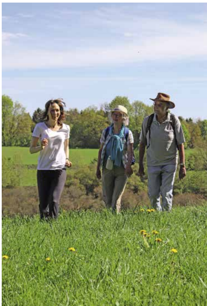
Vom Sofa hochkommen und aktiv werden! Joggen, wandern, spazieren – körperliche Aktivität steigert das emotionale Wohlbefinden.

PAFundDU-Redaktion, Thomas Tomaschek pafunddu.de/32368