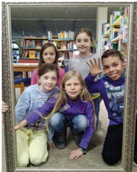
Die Teilnehmerinnen und Teilnehmer haben sich auch selbst in Szene gesetzt.