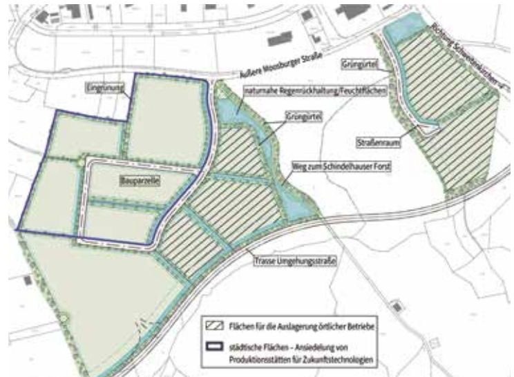
Kuglhof 2 bietet Platz, den Pfaffenhofener Betriebe für ihre Erweiterung brauchen. Die Stadt will zudem Produktionsstätten für Zukunftstechnologien ansiedeln.

Grundlage der Pfaffenhofener Wirtschaftskraft sind eine ausgewogene Mischung aus produzierenden Großunternehmen, innovativen „Kopfarbeitern“ und traditionellen Handwerksbetrieben sowie ein breiter Mix der Branchen. „Auf dieser Stärke können wir uns nicht ausruhen“, erklärt Herker. Die Krisen der letzten Zeit – von der Pandemie über gestörte Lieferketten bis zur Energiekrise – würden zeigen, dass es schnell zu Einbrüchen in der Konjunktur kommen kann. „Neuansiedlungen verbreitern die wirtschaftliche Basis. Dies hilft uns, weniger abhängig von einzelnen großen Gewerbesteuerzahlern zu sein.“ Eine weitere aktuelle Erfahrung: Pendeln wird zunehmend unattraktiv. Die Mobilitätskosten steigen, die Work-