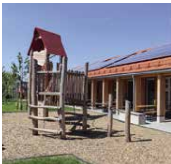
Gewerbesteuern sichern ein gutes Leben in Pfaffenhofen. Sie finanzieren u. a. Kindergärten wie die Kita „Am Hopfastadl“.

Mindestens ein Drittel der Flächen wird von Pfaffenhofener Traditionsfirmen belegt. Ihr Umzug macht Grundstücke in der Stadt frei, auf denen neue Wohnungen und Grünflächen entstehen können. Eine große Chance ist, dass die Kommune selbst über einen Teil der Flächen in Kuglhof 2 verfügt und steuern kann, wer diese bekommt: „Wir wollen Hersteller von Zukunftstechnologien zu uns holen“, sagt Bürgermeister