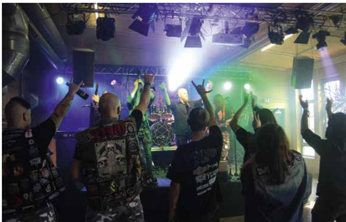
Post-Hardcore bis Death Metal – da bleibt kein Platz für Grübeleien und schlechte Stimmung. Die Besucher beim Crewsade of Metal-Festival im Jugendzentrum Atlantis können das bestätigen.

Jeden Tag darf ich erleben: Viele Menschen packen an, stehen gemeinsam für eine Sache und füreinander ein: egal ob beim ökumenischen Friedensgebet, in der Tafel, deren Trägerin unsere Kirchengemeinde ist, bei großen und kleinen Veranstaltungen in unserer Gemeinde und auch in meiner Familie. Eine meiner Töchter plant gerade ihre Hochzeit! Zuversicht ist angesagt gerade, wenn ich den Kopf nicht in den Sand stecke, sondern gemeinsam mit anderen Lösungswege für anstehende Probleme suche! Der Glaube trägt mich, dass Gott so ganz handfest seine Verheißung erfüllt: „Siehe, ich will ein Neues schaffen, jetzt wächst es auf, erkennt ihr's denn nicht? Ich mache einen Weg in der Wüste und Wasserströme in der Einöde.“ (Die Bibel, Jesaja 43,19)