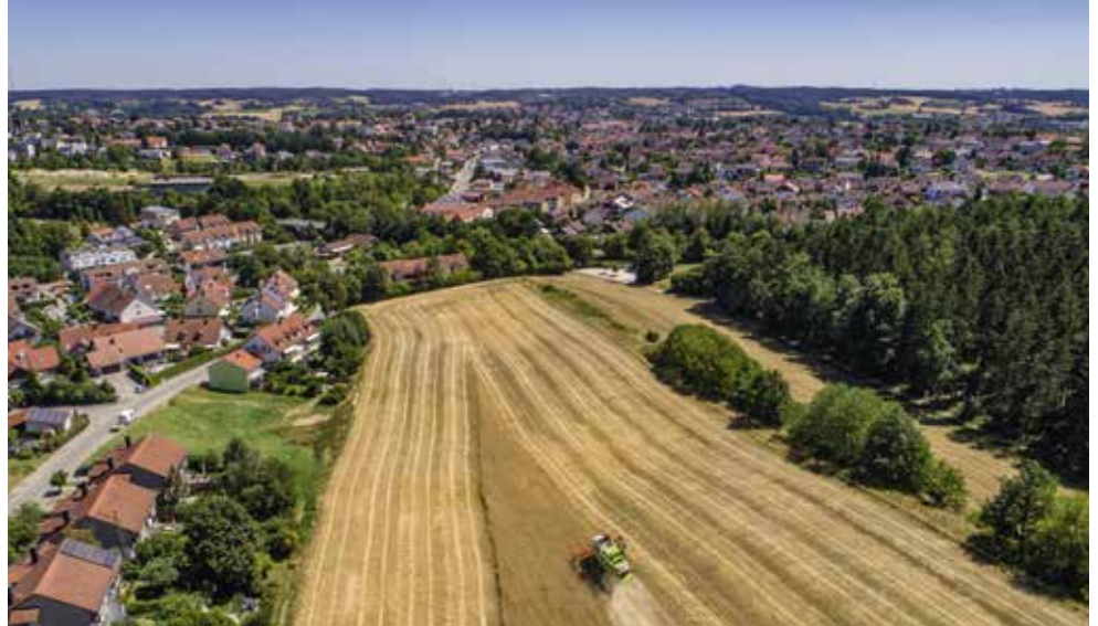
Das Getreide für die Volksfest-Brezen wächst vor der Haustüre.

Der Anteil an Bio-Lebensmitteln bei Veranstaltungen soll nach Vorgabe des Stadtrats Schritt für Schritt weiter erhöht werden. Für das Volksfest 2023 gilt deshalb, dass Kartoffeln teilweise und Backwaren, Käse und das Festbier ausschließlich in Bio-Qualität angeboten werden. Entsprechende Regelungen wurden mit den Festwirten und den Schaustellern getroffen. Zusätzlich sind alle gastronomischen Betriebe auf dem Volksfest dazu verpflichtet, den Besuchern die Herkunft ihrer verwendeten Lebensmittel transparent zu machen. Die Bio-Zertifizierung dieser Betriebe ist