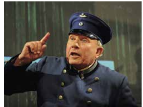
Der Einakter „Erster Klasse“ wurde beim Ludwig-Thoma-Abend im April 2016 aufgeführt.

Der Übergang vom Kinder- und Jugendtheater zum Erwachsenenschauspiel geschieht nahtlos.