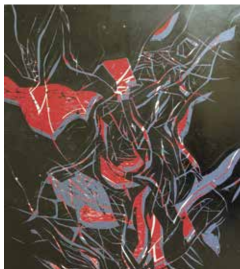
Helene Charitou | Holzschnitt | 2019

Ein Ort, der offen ist für Möglichkeiten, an dem sich Kinder und Erwachsene, Künstler und Musiker, Katzen und Hühner zentral und doch mitten