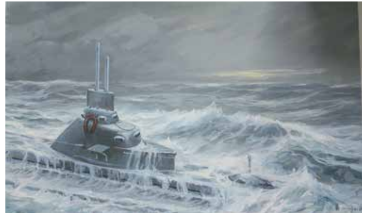
Bild des Marinemalers Viktor Gernhard von 1992: „Sturmfahrt um Skagen nach Kiel“