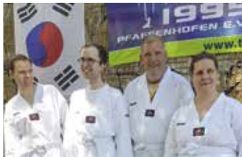
Teilnehmende am Taekwondo-Training auf dem Regens-Wagner Sommerfest

Gewalt gegen Menschen mit Beeinträchtigungen nimmt zu. Taekwondo gibt diesen „besonderen“ Menschen Sicherheit und wirksame Mittel zum eigenen Schutz. Der Verein Taekwondo 1995 Pfaffenhofen e. V. bietet Trainings für Menschen mit Behinderung.