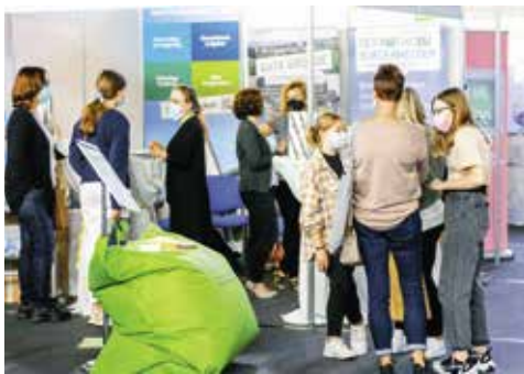
Stand der Stadt auf der Ausbildungsmesse 2021

Auch 2023 bietet die Messe „Ausbildungskompass“ eine gute Möglichkeit für Schülerinnen und Schüler zur direkten Kontaktaufnahme mit Ausbildungsbetrieben aus dem Landkreis.