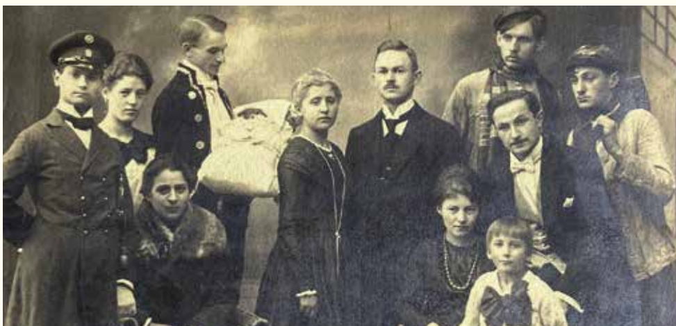
Darsteller des Theaterstücks „Das Schloß am Meer“, das der Gesangverein „Liederhort“ im Jahr 1919 auf die Bretter brachte

Andreas Sauer, Stadtarchivar pafunddu.de/34553