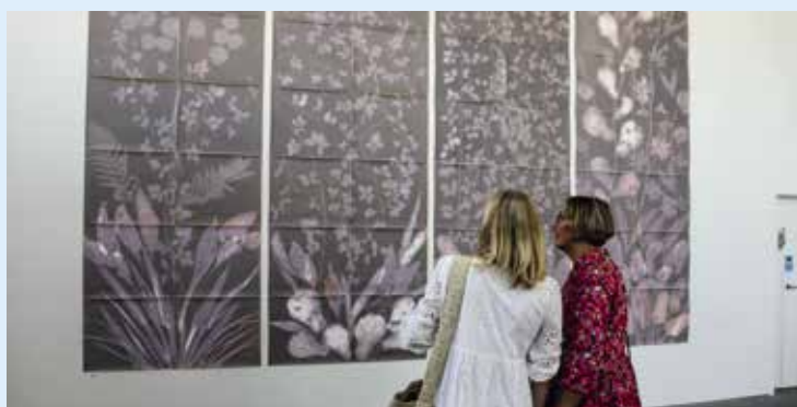
Der Neue Pfaffenhofer Kunstverein zeigte die Ausstellung „Fünf Tage im Garten“ von Günter Derleth. Der Fotokünstler stellte Arbeiten aus, die er alle mit der selbst gebauten „Camera obscura“ gemacht hat. Am 14. Juli wurde der Neue Pfaffenhofer Kunstverein mit dem Kulturpreis der Stadt Pfaffenhofen geehrt.