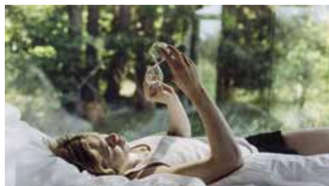
Charlotte Helwig | My Love For You Was Never Real | 2022

Beim Wettbewerb „gute aussichten – junge deutsche fotografie“ werden jedes Jahr alle deutschen Hochschulen und Akademien, die einen