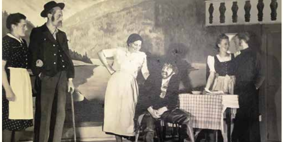
Im November 1948 kam mit großem Erfolg das Stück „St. Pauli in St. Peter“ von Maximilian Vitus durch die Jugend-Laienspielgruppe Pfaffenhofen zur Aufführung.

Nach dem Revolutionsjahr 1848, das auch in Bayern zu einer scharfen Zensur in der Presse und dem Verbot öffentlicher Veranstaltungen geführt hatte, kam es in den folgenden Jahren zu einer Lockerung. Zunächst traten auswärtige Theatergesellschaften wie mehrmals ab 1855