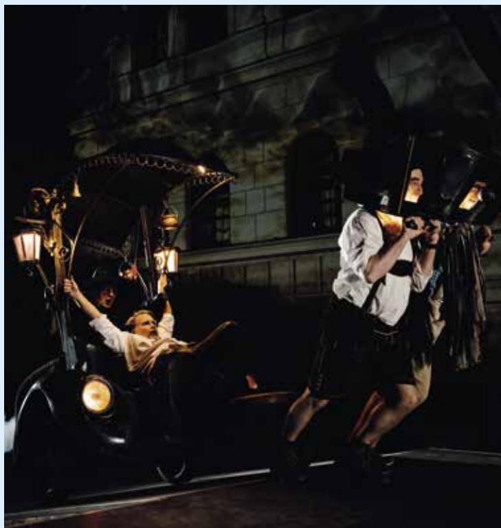
Freilicht-Aufführung „Der Brandnerkaspar schaut ins Paradies“: Der Boankramer kutschiert den Brandnerkaspar mit dem „Wagerl“ durch verschiedene Wetterlagen ins Paradies.