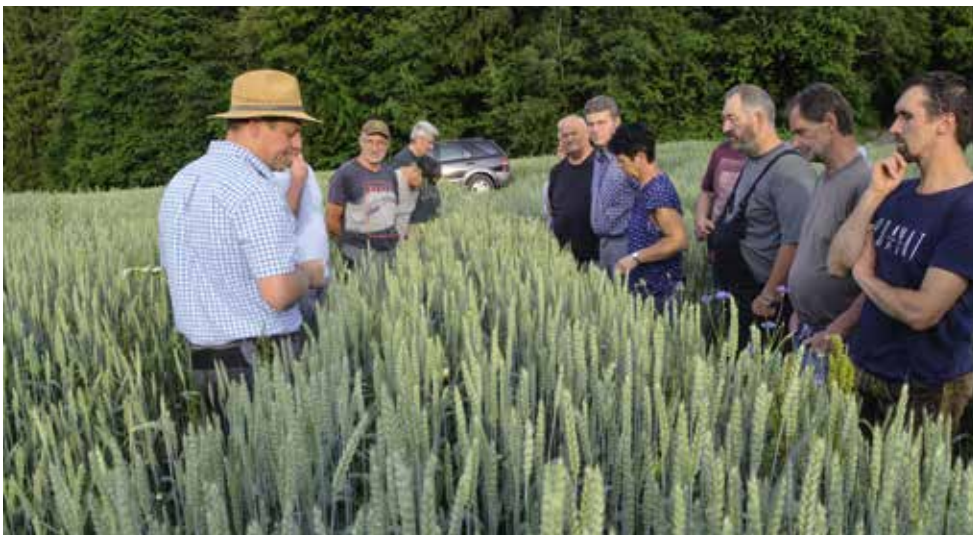
Arbeit der Bodenallianz – Gemeinsame Bestandsbeurteilung vor der Ernte

Die teilnehmenden Betriebe verbessern den Boden, indem sie im Wechsel unterschiedliche Pflanzenarten anbauen, den Boden schonend bearbeiten, den Pestizideinsatz reduzieren, die Düngung anpassen, kompostieren und Tiere artgerecht halten. So fördern sie die Artenvielfalt, schließen Nährstoffkreisläufe und leisten einen wichtigen Beitrag zum Klimaschutz. Denn nur gesunde und aktive Böden können Wetterextreme wie Starkregen und Dürren besser aushalten. Auch für den Schutz unseres wichtigsten Lebensmittels, des heimischen Trinkwassers, sind