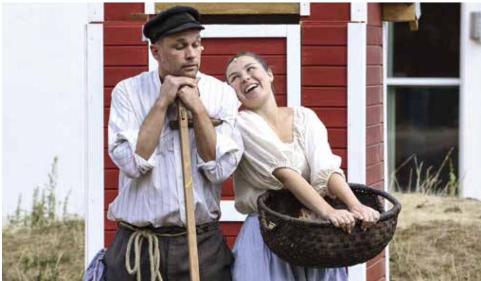
Beim Stück „Michel in der Suppenschüssel“ verwandelte sich im Kultursommer 2022 der Pausenhof der Josef-Maria-Lutz-Schule in das beschauliche Katthult in Schweden.