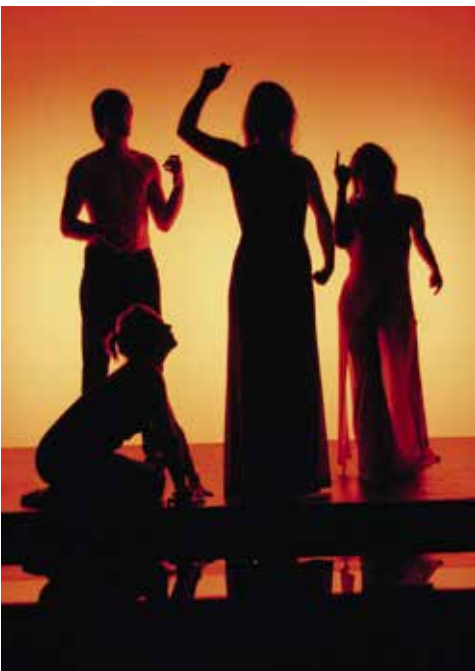
Elektra, eine Tragödie, basierend auf dem gleichnamigen Werk des griechischen Dichters Sophokles, wird unter der Regie von Falco Blome 2004 auf der Bühne zum Leben erweckt.

Der Nachwuchs liegt dem Verein besonders am Herzen. So ist die Kinder- und Jugendarbeit und