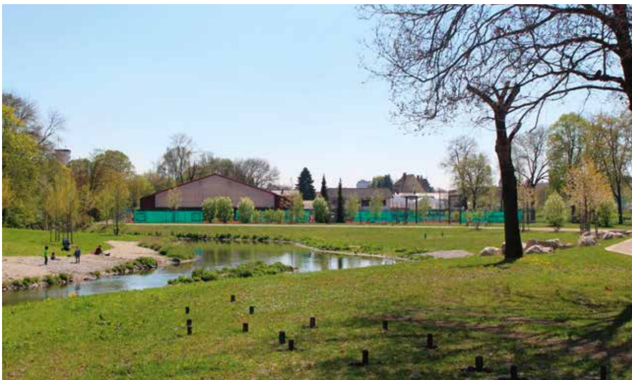
Das Ilmufer hinter den Sportplätzen wurde auf 500 Metern Länge zu einem „Stadtstrand“ umgestaltet.

Apropos Geld: Die Gartenschau lohnt sich auch für die örtlichen Händler und Gastronomen. In dem Wissen, dass die letzten vier „kleinen“ Gartenschauen jeweils etwa 300.000 Besucher angezogen haben, die im Schnitt 20 Euro ausgegeben haben, ergibt das einen Umsatz von sechs Millionen Euro, der als Kaufkraft in der Stadt bleibt. Eine Gartenschau ist also auch ein Stück Wirtschaftsförderung. Speziell für die „grüne Branche“ ist sie eine ideale