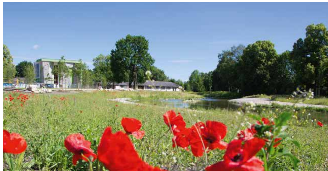
Blühende Mohnwiese am Ufer der IIm

Der neue Gewässerlauf wurde in Anlehnung an den naturnahen Zustand der IIm geschwungen gestaltet. Die Ufer der ca. zwei Meter unter Gelände fließenden IIm wurden abgeflacht, so dass das Gewässer nun wieder leicht zugänglich ist – insbesondere im Bereich der IIminsel und des Sport- und Freizeitparks.