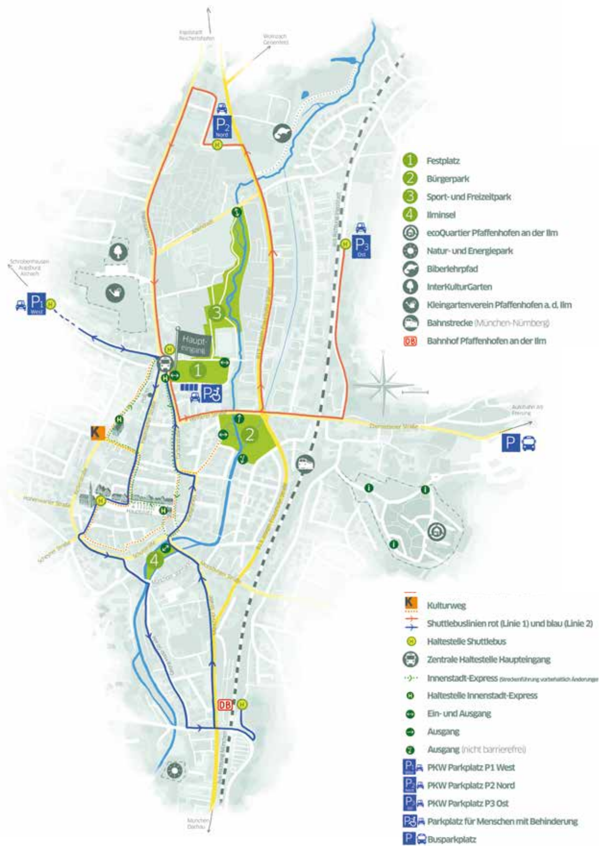
Das Gartenschaugelände zieht sich wie ein grünes Band entlang der Ilm durch die Stadt.

Möglichkeit, vor großem Publikum die eigene Leistungsfähigkeit darzustellen. Durch eine Gartenschau steigt die Motivation zur Begrünung – auf privater und öffentlicher Seite. Nachfrage und Absatz steigen.