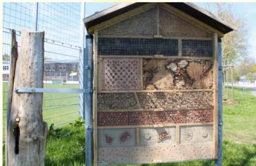
Das Insektenhotel im Sport- und Freizeitpark wurde von ehrenamtlichen Mitarbeitern des Seniorenbüros gebaut und vom Bund Naturschutz mitfinanziert.

„Tiere und Pflanzen an der Ilm“ ist das Thema am 8. und 23. Juli; um den „Baumeister Biber“ geht es dann am 30. Juli und 5. August, jeweils von 10 bis 16 Uhr. Bei kleinen Experimenten, Spielen und weiteren Aktivitäten gewinnen die Teilnehmer Einblicke in die beeindruckende Lebendigkeit an Pflanzen und Tierchen der „Wasserwelt“.