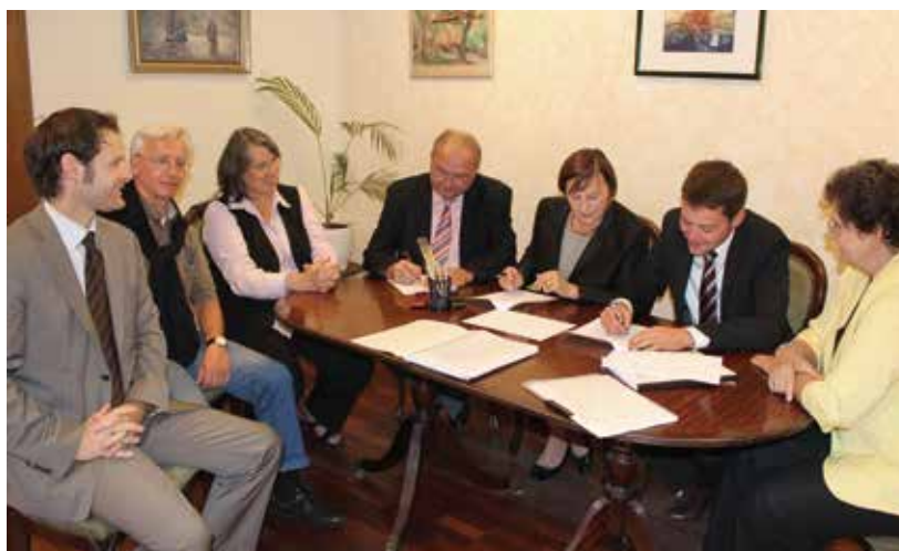
2010 wurde der Vertrag für die Ausrichtung der Gartenschau unterzeichnet.