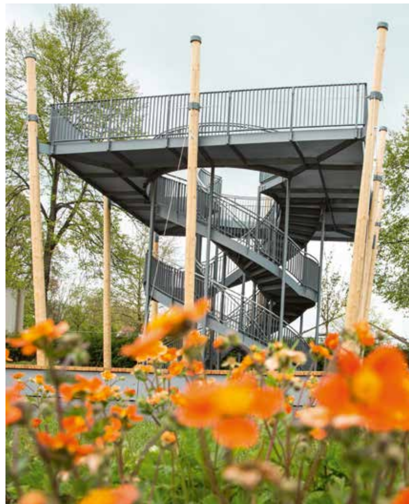
Der Hopfenturm im Bürgerpark