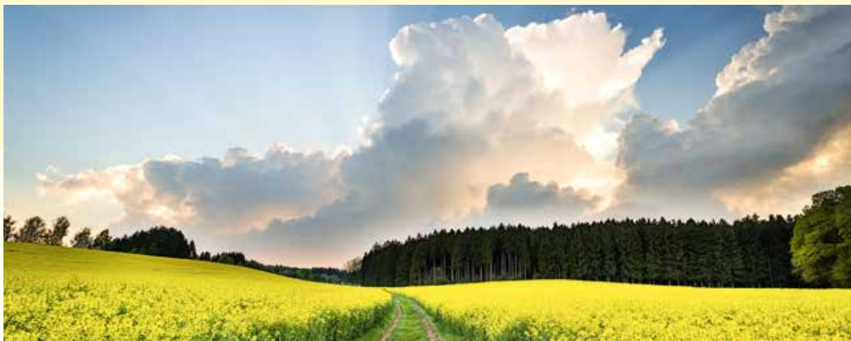
„Wolkenschieber“ von Bernd Pfeiffer

Die Fotofreunde laden außerdem zu einer Fotoreise durch das Gartenschau-gelände ein. Die Teilnehmer tauchen gemeinsam in die Welt der Makrofotografie ein und versuchen, Schmetterlinge mit der Kamera einzufangen. Ein Makroobjektiv, Zwischenringe oder Nahlin-sen sowie ein Stativ sind hilfreich, aber nicht zwingend erforderlich. Treffpunkt ist am 4. Juni um 13 bzw. 15.30 Uhr im Forum im Bürgerpark.