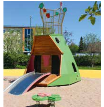
Die neue Froschkönig-Rutsche

so dass dort jetzt auch ein lebender „Fritz der Frosch“ die Kinder begrüßt.