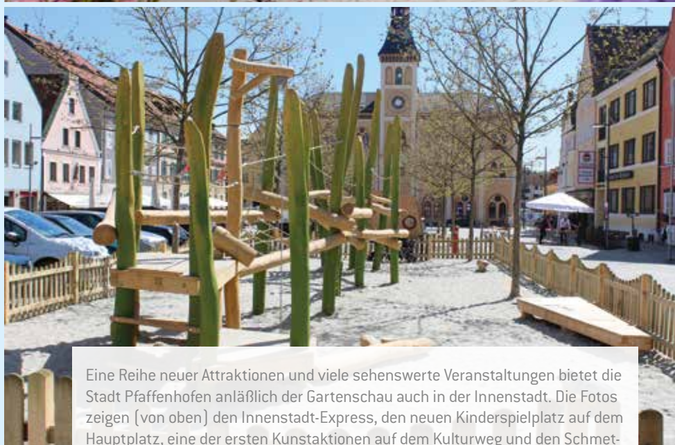
Eine Reihe neuer Attraktionen und viele sehenswerte Veranstaltungen bietet die Stadt Pfaffenhofen anlässlich der Gartenschau auch in der Innenstadt. Die Fotos zeigen (von oben) den Innenstadt-Express, den neuen Kinderspielplatz auf dem Hauptplatz, eine der ersten Kunstaktionen auf dem Kulturweg und den Schmetterling, der im Mittelpunkt der HiPP-Ausstellung im Rathaus steht.